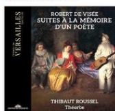
VISSE Œuvres pour théorbe. Thibaut Roussel. CVS. Fort d'une technique magistrale, Thibaut Roussel se livre en profondeur des compositions pour théorbe du maître de guitare du Roi Soleil.