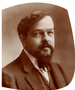
Claude Debussy 1862/1918