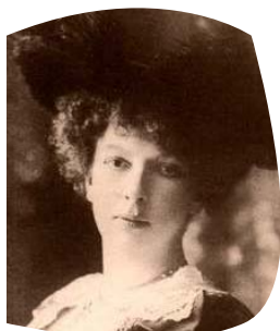
Cécile Chaminade 1857/1944

J'ai déménagé à Londres il y a 5 ans et d'une manière un peu étrange, je ne me suis jamais senti autant connecté à mes racines et ma culture française que depuis mon départ. Le temps passe, et finalement l'idée de dédier mon premier disque à la musique française, cette même musique qui m'a donné goût au piano me semble évidente. Si la musique de Claude Debussy m'a toujours accompagné, j'ai découvert Cécile Chaminade bien plus tard, en 2021, et j'ai été enthousiaste de découvrir quelle pianiste star elle avait été. Sa musique m'a immédiatement parlé, et quand j'ai réalisé qu'elle avait vécu à la même époque que Claude Debussy, j'ai eu envie de les réunir tous les deux. Non pas pour les comparer, ils ont chacun leur style propre, mais plutôt pour rendre hommage à ces deux figures qui ont participé au rayonnement et à la renommée de la musique Française dans le monde entier.